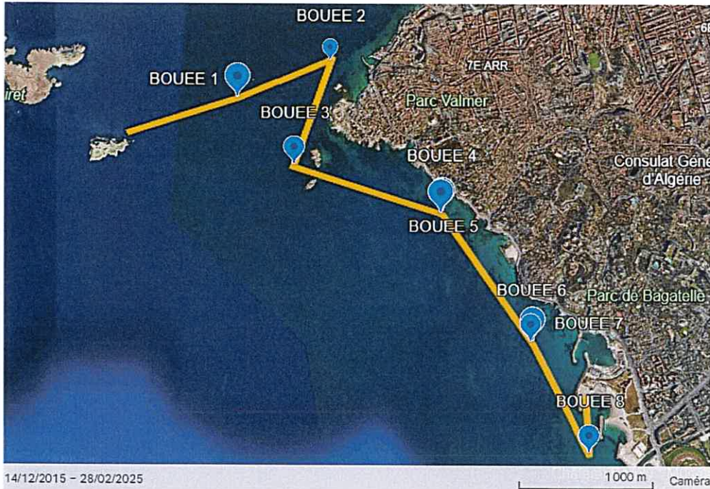
Parcours 6 km