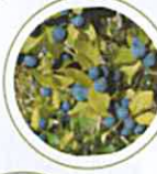
Flaire à feuilles larges