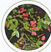
Erable de Montpellier