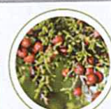
Genévrier de phénicie