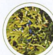
Flaire à feuilles étroites