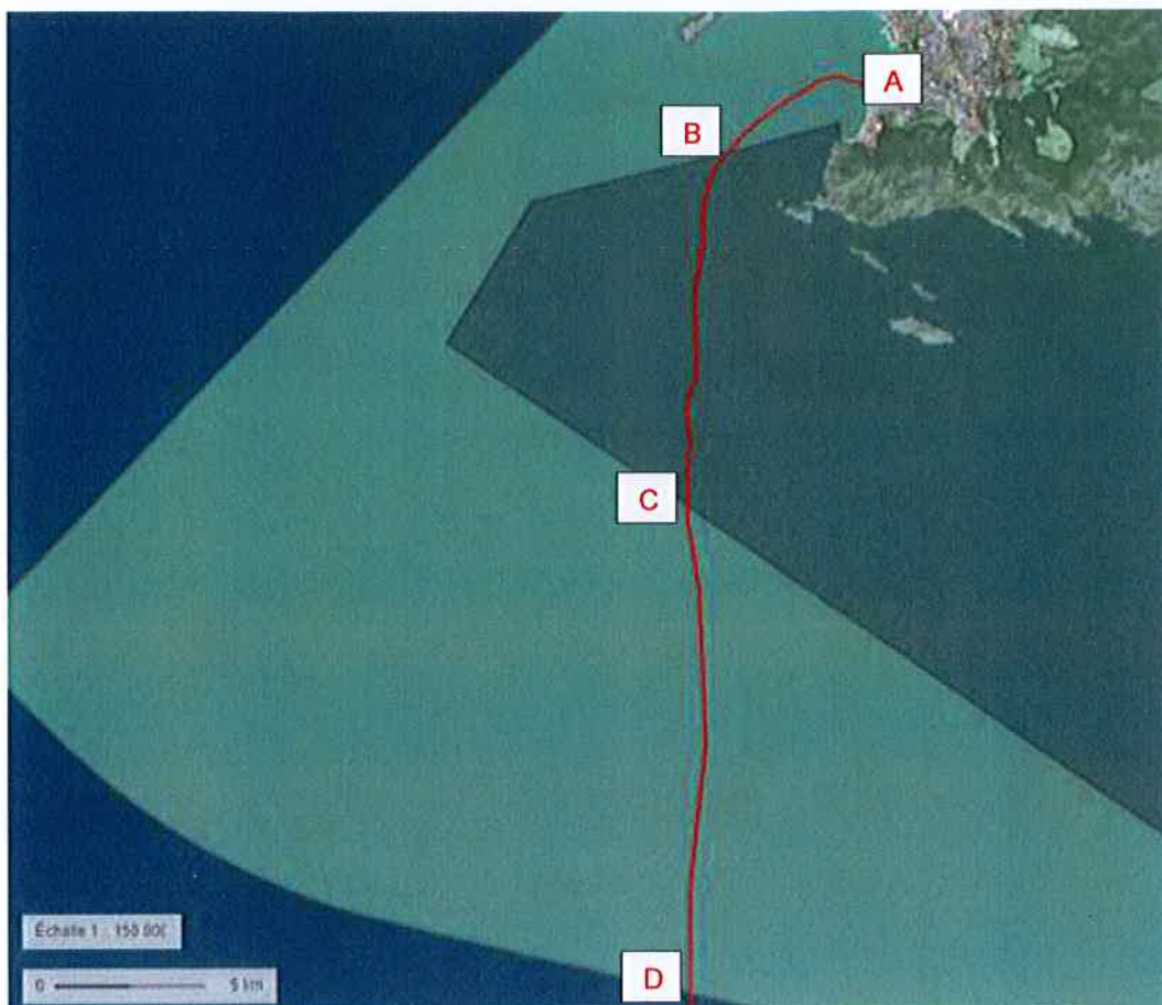
Carte 2. MEDUSA-SEG01 parcourt une distance de 11,8 km en cœur marin et 22,1 km dans l'AMA du Parc national des Calanques. Les points remarquables de la route sont :