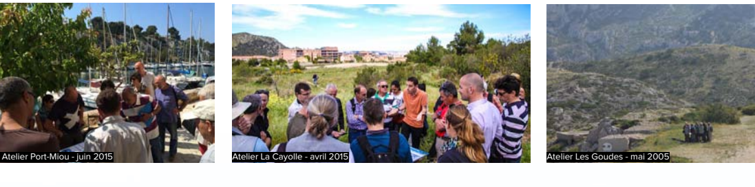
Atelier Port-Miou - juin 2015

Les cinq prochains ateliers sont déjà programmés