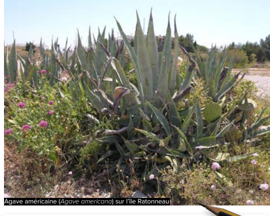
Agave américaine (Agave americana) sur l'île Ratonneau

« Le problème avec les agaves c'est que ça pousse très vite et ça se répand à une vitesse incroyable. C'est pas endémique de la région et elles sont trop présentes dans les Calanques. Il ne faut pas forcément tout enlever mais sur certains endroits elles ne devraient pas y être. »