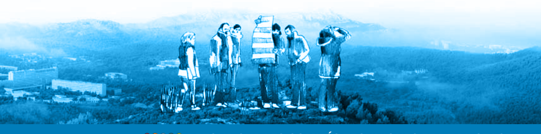
Atelier Les Goudes - mai 2015