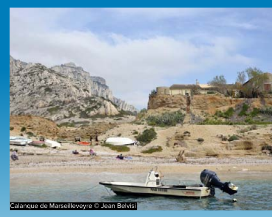
Calanque de Marseilleveyre

L'Observatoire Photographique du Paysage vu depuis la mer [1] est un outil innovant à plusieurs titres. Son échelle est ambitieuse puisqu'il couvre 1000 km de la Camargue à l'Italie, incluant l'Etang de Berre et les îles. Il teste l'extrapolation du protocole des Observatoires Photographiques du Paysage « les pieds dans la mer ». Outil prioritaire des politiques de paysage, il vient conforter la démarche engagée de Plan Paysage par le Parc national des Calanques. Aujourd'hui, le projet est en phase de clôture avec une première reconduction : les 150 photographies doivent être, à terme, renouvelées à pas de temps régulier. Cet été, l'Observatoire Photographique du Paysage Amers sera disponible offrant au public et aux acteurs du littoral un site internet dédié. Une exposition destinée à circuler pour nourrir le débat sur les enjeux complexes du littoral sera disponible ultérieurement.