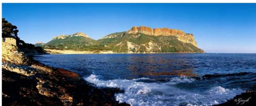
Cap Canaille

Aux portes de la deuxième ville de France, subissant des pressions multiples (pression urbaine, pollutions, surfréquentation, prélèvements excessifs, incendies de forêt...), ce joyau naturel fait depuis près d'un siècle l'objet d'une volonté forte de protection issue d'associations d'habitants et d'usagers.